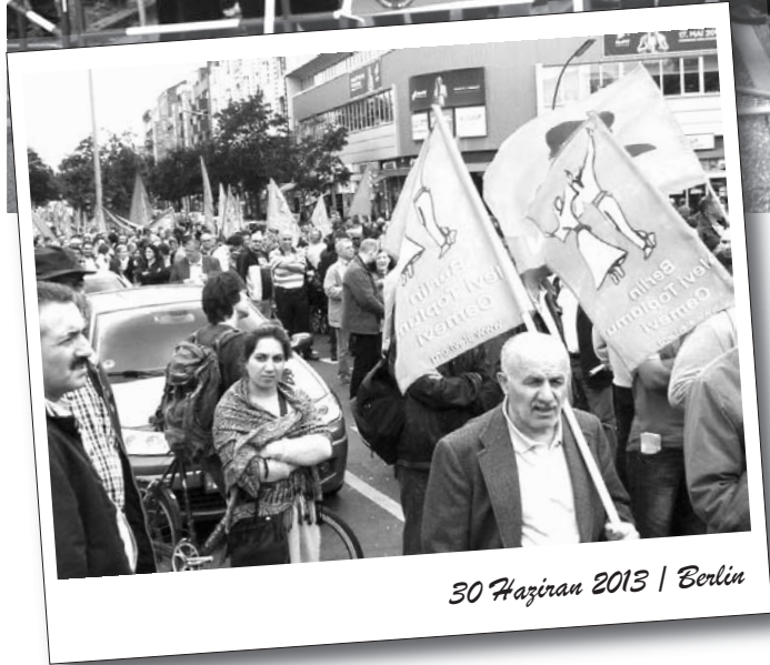
30 Haziran 2013 | Berlin