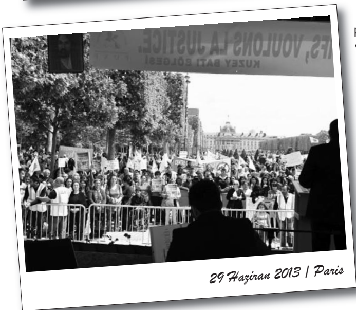
29 Haziran 2013 | Paris

komitesinin koyduğu yasaklar nedeniyle hiçbir devrimci-demokratik kurum ya da partiye pankart/flama açma ve konuşma hakkı verilmedi.